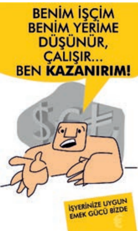
İsmail Cem Özkan